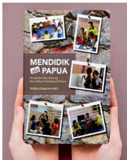
Omslag van het boek

Hapin (Hulp Aan Papoea's In Nood) combineerde politieke neutraliteit met