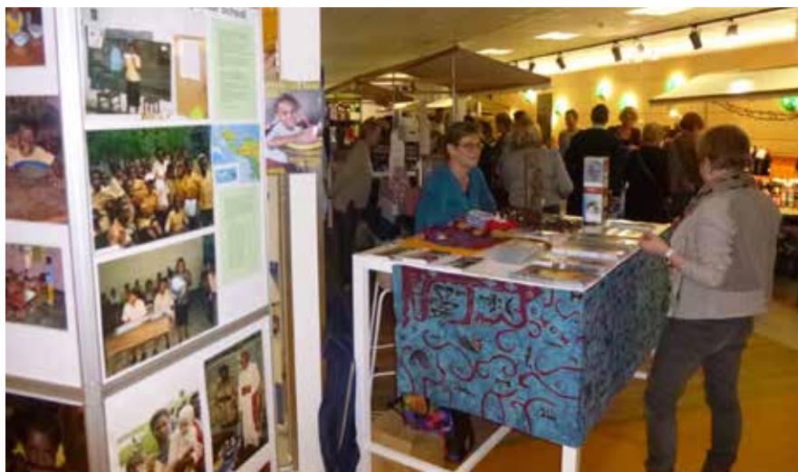
De PJNS kraam op de kerstmarkt van Stichting Landstede, MBO

De laatste jaren herdenken donateurs van het eerste uur nog steeds hun werk- of woonrelatie met Papoea, door ons op te nemen in hun testament. Wat een verrassende steunbetuigingen!