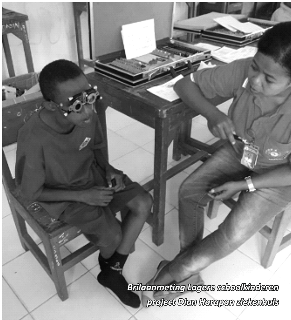
Brilaanmeting Lagere schoolkinderen project Dian Harapan ziekenhuis

Ook werden bij twee lagere scholen kinderen op gezichtsvermogen onderzocht en aan de kinderen waar nodig, een bril verstrekt. De scholen waren te Sentani en in Arso, gemeente Keerom.