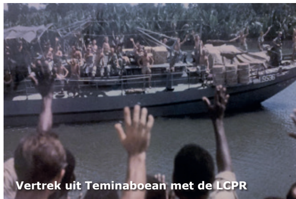
Vertrek uit Teminaboean met de LCPR