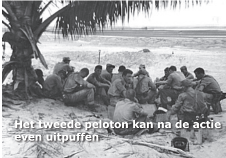
Het tweede peloton kan na de actie even uitpuffen

Hier wordt bivak gemaakt en terwijl de meegekomen verbindingsman de kazerne in Merauke inlicht maakt de rest een aantal wachtposten gereed. Het wordt een nacht die ik niet snel vergeet. Je bemant een paar keer een van de wachtposten, probeert tussendoor wat te slapen maar onophoudelijk maakt een angstige spanning zich van je meester. Aardedonker is het, je zit of ligt daar vrijwel onbeschermd en je hebt geen idee van wat er zich op honderd, of vijftig, of tien meter afstand van je afspeelt. Eindelijk wordt het weer licht.